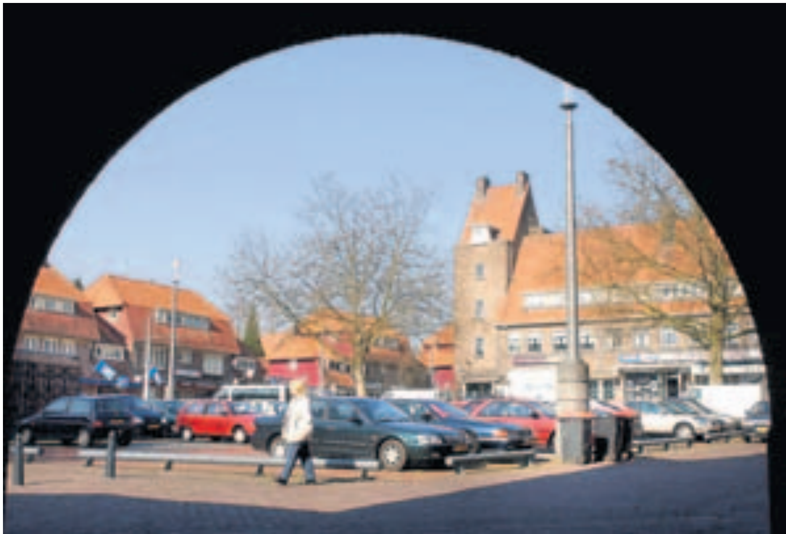
Straatbeeld van de Geitenkamp, een van de wijken in Arnhem waar mensen een beroep doen op buurtbemiddeling.

De prijs is voor Putman geen reden op zijn lauweren te rusten. 'Het is net als met een Michelinster in de horeca: als je er een hebt, moet je iedere dag bewijzen dat je hem waard bent.'